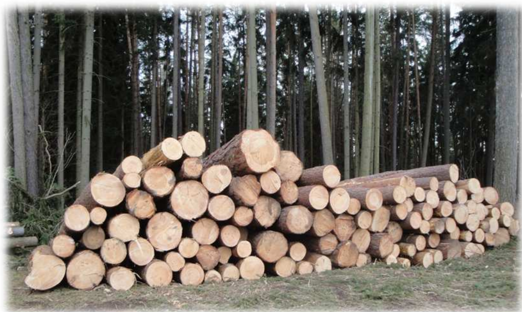
Těžba dřeva v obecním lese – pro kontrolu 😊

Laicky řečeno, máme v obecním lese dost velkou zásobu dřeva v porostech mýtně zralých. Tím, že budeme oddalovat těžby, neznamená, že dřevo vzrostlých stromů zůstane nadále zdravé, ale vlivem hnilob se časem znehodnotí nejcennější části kmene. Tyto porosty bude třeba postupně dle lesního hospodářského plánu těžit a zakládat nové.