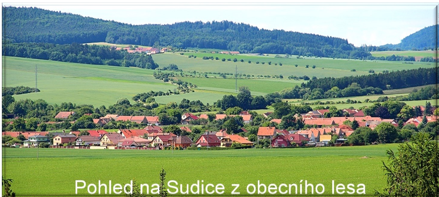
Pohled na Sudice z obecního lesa

I přes tento menší nedostatek jsme šťastní, že se nám po dlouhých peripetiích podařilo opravit další místní komunikaci, která po novém povrchu volala již několik dlouhých let. A snad jsou s námi spokojeni i ti, kteří se zasadili o zdržení celé akce zbytečnými průtahy v řízení. Původně jsme mysleli, že letos opravíme i náves, ale po jednáních s krajským úřadem a svazkem vodovodů a kanalizací, jsme tuto opravu zatím zastavili. Důvodem je šetření financí v případě, že by se nám povedlo přesvědčit Jihomoravský kraj k opravě průtahu obce. Tato silnice je ve vlastnictví Jihomoravského kraje a pokud by se prováděla celková oprava, tak je to vázáno i rekonstrukcí staré kanalizace od obchodu po náves. A právě tam chce Svazek vodovodů a kanalizací, aby se finančně obec spolupodílela. Často slýchávám z Vašich úst, proč s tím nic neděláme. Pravdou zůstává, že jsme již podstoupili spoustu jednání a schůzek, ale narážíme stále jen na nedostatek peněz. A po povodních bude ještě hůře, neboť finance, které vyčlenila vláda na opravy silnic pro kraje, půjdou do škod v oblastech povodní. Přesto se nevzdáváme a budeme pokračovat v jednáních dál. Proto buďte trpěliví, nelze všechno stihnout opravit a vyjednat za dva tři roky, když nyní všude chybí peníze. V minulosti finance byly, ale to byl zase problém pro pana starostu opustit kancelář úřadu a vyrazit do „světa“. Ti co vyrazili a jednali, tak mají opraveno, například po sudický dvůr.