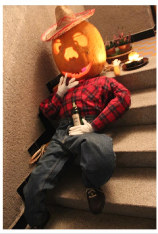
2. cena - pan „Roupák“