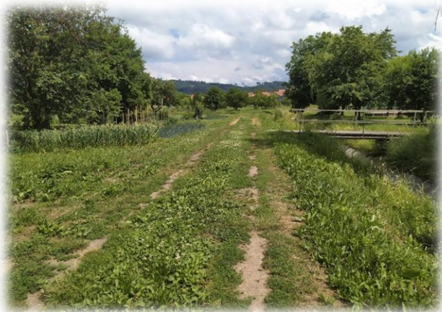
cesta za potokem před zpevněním