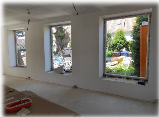
Foto z rekonstrukce z července 2022

Přípravné práce na opravě historické budovy Sudické školy už započaly, první etapa rekonstrukce musela proběhnout do konce srpna, aby se škola mohla od září otevřít. Celá rekonstrukce vyjde dle plánovaného rozpočtu na více než 6,5 milionu korun. Obnovu školy podpořila obec Sudice částkou 2,5 mil. Kč, už se nám podařilo sehnat některé dotace a o další usilujeme, část peněz na investice je sbor ochoten si vypůjčit. Budova školy je naštěstí v relativně dobrém stavu, má zánovní střechu a dobře dopadla i kontrola statiky. Budova potřebuje novou čističku odpadních vod a opravu kanalizace, nové elektrické rozvody, sanační omítky, nová okna a podlahy, nové vytápění, nové sociální zařízení a částečnou přestavbu interiérů, aby zde mohly vzniknout pěkné školní třídy, zázemí pro mateřskou školu, výdejna jídla a družina.