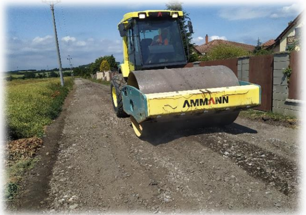
cesta před obcí – zpevnění technologií stabilizace